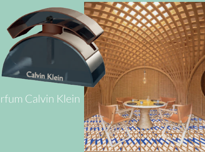
Parquet pour petit h