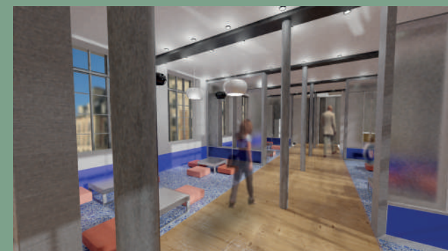
Restaurant social house