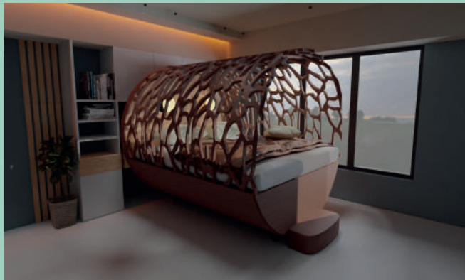
Création d'un lit pour le concours Elite