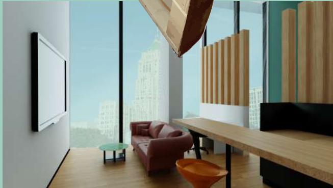
Studio pour étudiant à Détroit, USA